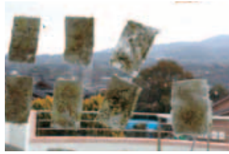
玉名市地域活動支援センター

令和3年8月9日にミニ夏祭りを行いました。カラオケ大会では利用者様が玄人並みのパフォーマンスを披露してくださいました。