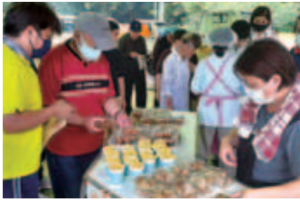
ワークセンターみすみ

令和3年8月9日にミニ夏祭りを行いました。カラオケ大会では利用者様が玄人並みのパフォーマンスを披露してくださいました。