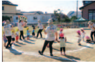
小規模保育所 でんでん

利用者様が好んで取り組むレクリエーションのひとつがボウリングです。一投一投、ねらいを定めます…!