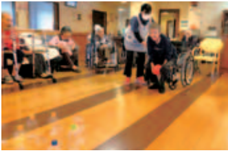
ケアビレッジたがの里

利用者様が好んで取り組むレクリエーションのひとつがボウリングです。一投一投、ねらいを定めます…!