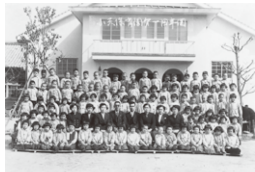
第一回小天保育園卒園者