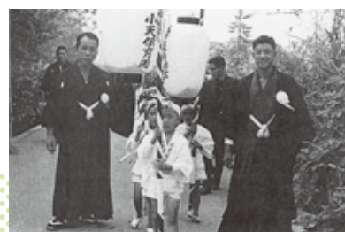
第一回若宮天子宫大祭、神幸行列