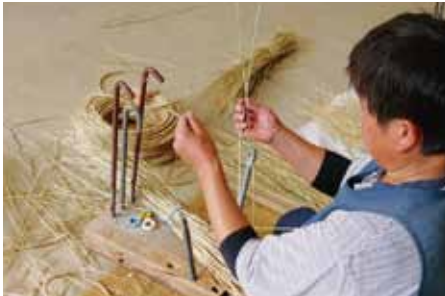
わらの選別処理。きれいなわらをここで 選別します。きれいな商品にする為、 大切なお仕事です。