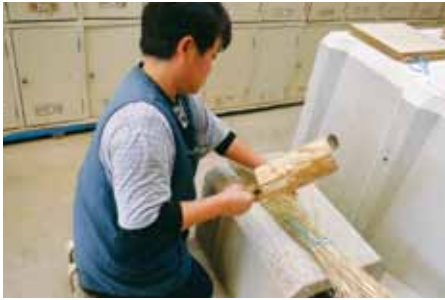
編みやすくするために、たたいてほぐします。 これがけっこう、大変な作業なんです。