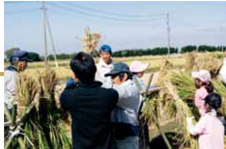
かけ干して、わらを干します。