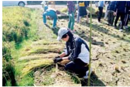
縄の原料づくりから始まります。