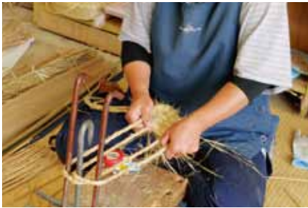
見せ場のわらを編むところです。 お客様の希望にあわせて、 様々なサイズを編んでいきます。